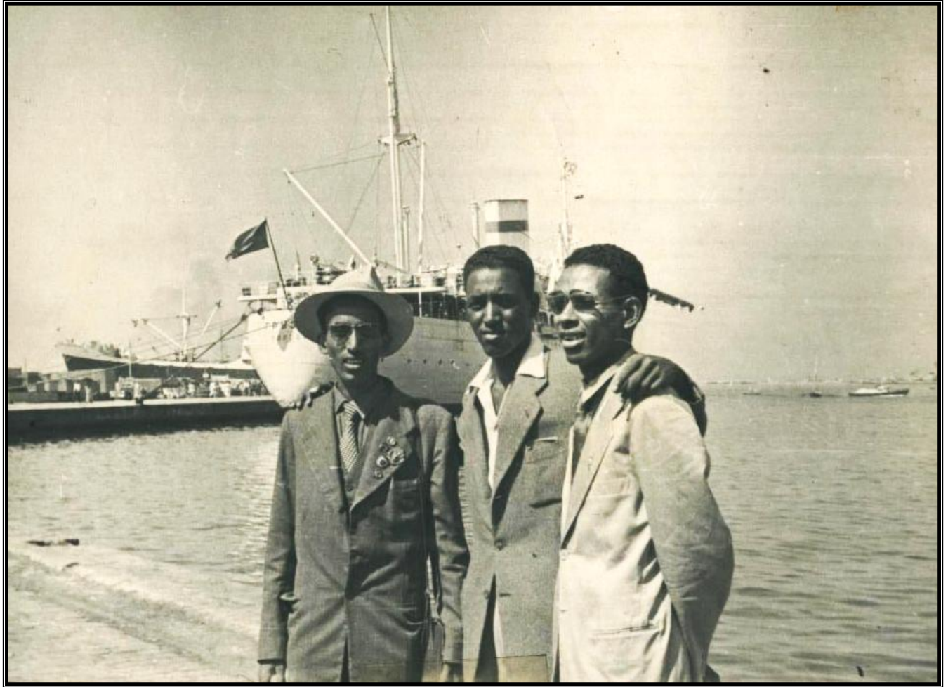
مع طلبة من الصومال اثناء السفر الى موسكو من اسكندرية لحضور مؤتمر الشباب الديمقراطي العالمي وحضر المهرجان الذي أقيم في مدينة موسكو عام 1957 م.