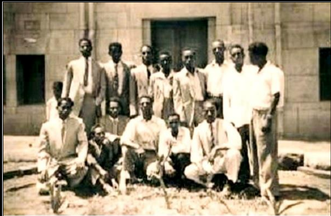
صورة تذكارية لبعض الطلاب الارتريين الذين اسسوا "الجمعية الخيرية" عام ١٩٥٠ م.