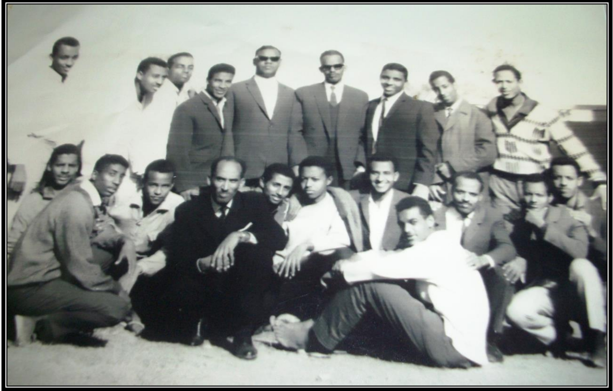
مع بعض الطلبة في القاهرة