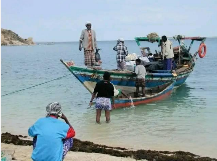
Figure 6 - ባህላዊያን ነጋዶን ገፈፍትን ዓሳ ህዝቢ ዓፈር ኤርትራ

ማሕበር ባሕረኛታት ኤርትራ ኣብ ባህላዊያን ባሕረኛታት ብዘለዎ ተገዳስነት ንህሉው ኩነታት ህሉው ኩነታቶም ብወሽጥን ብደገን ኣብ ምክትታል ይርከቡ። ኣብ ቀረባ እዋናት ብዝተፈላለዩ ምንጭታት ዝቀርብ ዘሎ ጸብጻባት ኣሻቃሊ እዩ። እዚ ንለቦዳ ሽርክ ኣብ ጢሮ ደንክላያ ምስ ብርቱዕ ዕልቅልቅ ውሕጅን መጥቓዕቲ ሓቲ ኣብ ቀይሕ ባሕሪ ካልእ ወሽጣዊ ጸቅጢ መንግስቲ ኤርትራን