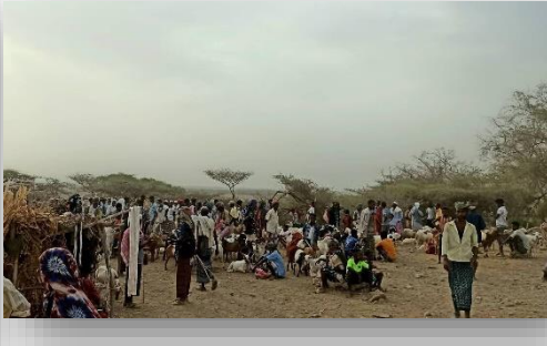
Figure 8 - ስእላዊ መግለጺ

እዞም ባህላዊያን ባሕሪኛታት ጠቅሊሎም ንክይጸንቱ ማሕበር ባሕሪኛታት ምስ ግዳሳት ማሕበራት ኣብ ምስራሕ ይርከቡ። ኣብ መደምደምታ፣ ማሕበር ባሕሪኛታት ኤርትራ ንሃገራት ገማግም ቀይሕ ባሕርን ናይ ባሕርያ ትካላተንን፣ ሕብረት ኣፍሪቃ፣ ሊግ ዓረብ፣ ከምኡውን ኢጋድ፣ ምስ ትካል ሕቡራት ሃገራት (UN) ዝኮነ (IMO)፣ UNEP፣ Greenpeace MENA፣ PERSGA፣ IUCNን ወዘተ.... ግዳሳት ማሕበራትን ትካላትን ብምውህሃድ ብምስራሕ ነዚ ኣብ ቀይሕ ባሕሪ ኣጋጢሙ ዘሎ ቀዳሞት ተጎዳእቲ ንሳቶም ሙካኖም ኣሚኖም ንድሕነትን ውሕስነትን ቀይሕ ባሕሪ ክሰርሑ ይጽውዕ። ኣብ ቀይሕ ባሕሪ እናተጋደደ ዝኸይደ ዘሎ ክባብያውን ጸጥታውን ስግኣታት ንምፍታሕ ቅልጡፍ ስጉምትን ኣህጉራዊ ምትሕብባርን ክውሰድ፣ ከምኡውን ንኣይልታት ሓቲ ክኩነኑን ኣማራጺ ፍታሕ ንምርካብን ክላዘቡን ንጽውዕ።