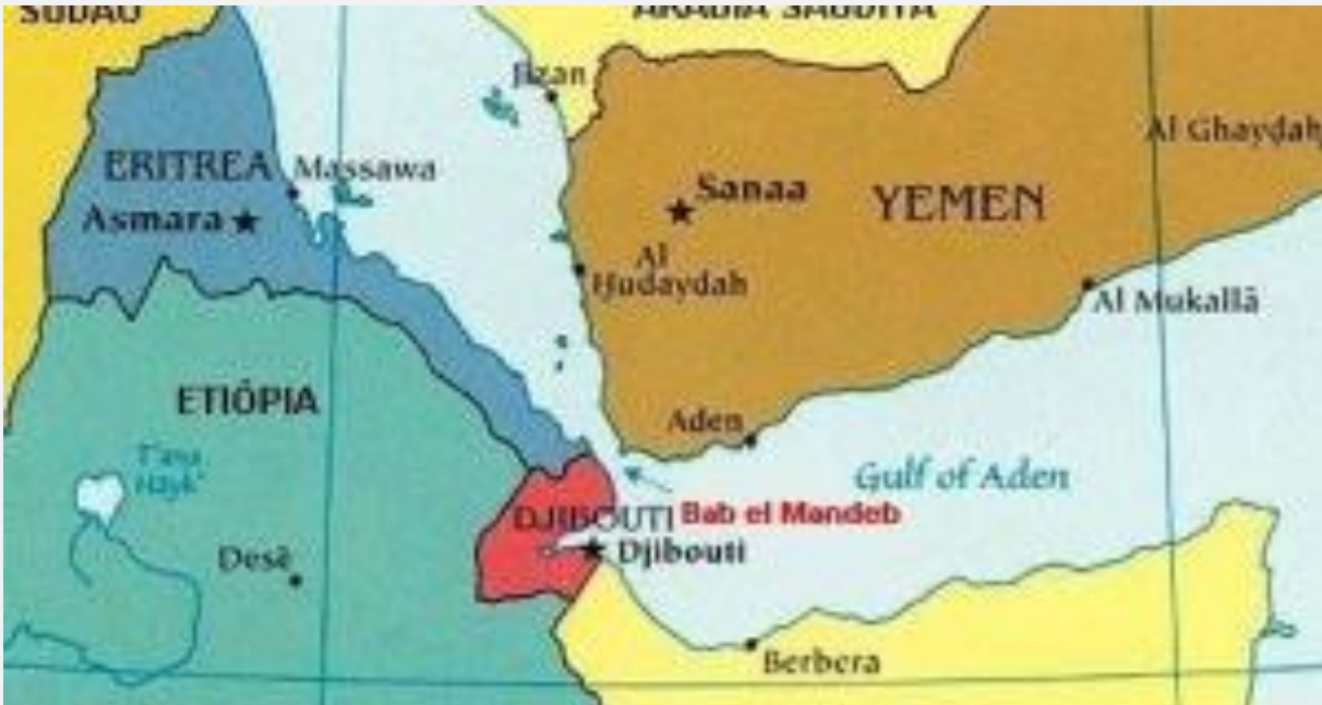
Figure 1. Bab el Mandeb map

ማሕበር ባሕራን ስራ ስርዓት (ማባኤ) ከም መቀጸልታ ኣብ ህሉዉ ዘባዊ ኩነታት ቀይሕ ባሕሪ ጽልዉኡን ኣመልኪቱ ከቅርብ ዝጸንሖ ትንታኒታት ከም ዘመልከቶ ኣብ መስመር መጋገዝያ እቲ ባሕሪ፣ ባሕራን ስራ ስርዓት፣ ድሕነት መስመር ቀይሕ ባሕርን ባህርያዊ ተፈጥሮኡን ብመጥቓዕታት ሓይልታት ሓቲ የመን ኣብ ሓድሻ ዝበኣሰ መድረክ ምእታዉ እዩ።