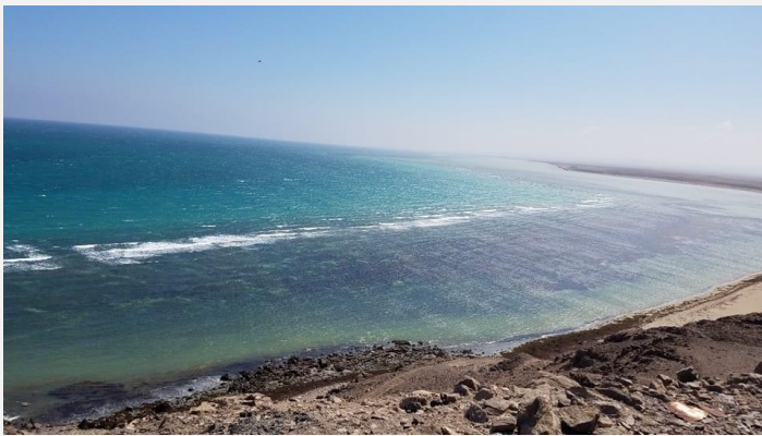
Figure 5 - ብከላ ባሕሪ

እዚ መጥቓዕትታት ንኣካል ሕብረተሰብና ዝኮነ ህዝቢ ዓፋር ኤርትራ፡ ንጥፊታት ባህላዊያን ብቀንዱ ብሓፈሻ ምግፋፍ ዓሳን ንግዲ ባሕሪን ዝኣመሰሉ ንጥፊታት ብከቢድ ተወሳኪ ሃስይዎም ገሩሉ ይርከብ። ኣብ መነባብሮ ኤርትራውያን ባህላዊያን ገፈፍቲ ዓሳ ዘባታት ደንከል ህዝቢ ዓፋር ኤርትራ ብቐጥታ ተጻልዮ ምህላወ ምንጥታትና ዘረጋግጽዎ ናይ ባይታ ሓቂ እዩ። ኣብ ዝሓጸረ መፍትሒ እንተዘይተገይሩሉ፡ ኣብ ልዕሊ ስነ-ህይወት ሃብትቲ ባሕርን ዘጋጥም ናይ ነዊሕ እዋን ጉድኣት ንኸጽገን ዉን ዓሰርተታት ዓመታት ክወስድ ዝከእል እዩ። ኣብ ሓጸር እዋን ፍታሕ እንተዘይተገይሩሉ፡ ኣብ ገማግም ቀይሕ ባሕሪ ዝርከባ ዘይከህልወን ስለዝኸእል፡ ነቲ ዕንወት ንምግታእን