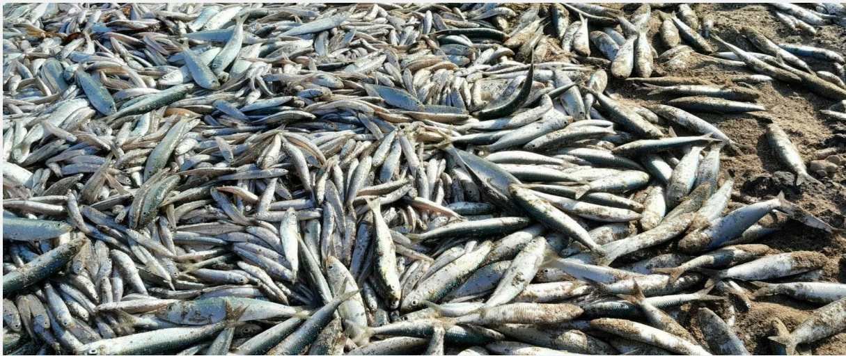
Figure 7 - ዝተበከሉ ዓሳታት

ከም ዝፍለጥ ባህላዊያን ባሕሪኛታት ህዝቢ ዓፋር ኤርትራ ነቲ ንዘመናት ከም ምንጨጢ ኣታዊኦም ዝኮነ ከም ምግፋፍ ዓሳ፣ ንግዲ ባሕሪ ምስ ጎረባብቲ ሃገራትን ካልእ ባህርያዊ ትዕድልቲ ቀይሕ ባሕሪ ንክይጥቀሙሉ ብመንግስቲ ኤርትራ ንልዕሊ 20 ዓመታት ብዝተፈላለዩ ምስምሳት ስለ ዝኣገዱም ኣብ ፍቀዶ ሃገራት ስደተኛታት ከይኖም ፋሕ ከብሉን ባህላዊ ስራሕ ባሕሪ ናብ ዘመናዊ ተለዊጡ ህዝቢ ኤርትራ ንክይጥቀሙሉ ጌሩ እዩ።