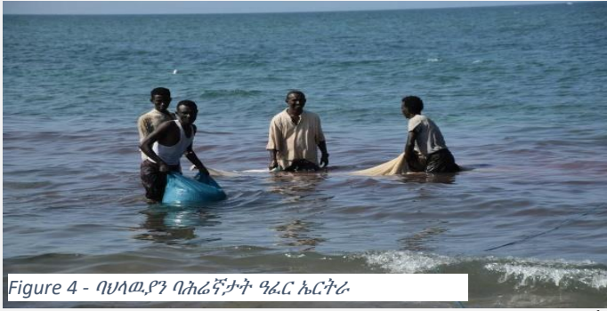
Figure 4 - ባህላዊን ባሕረኛታት ዓፈር ኤርትራ

ሃገራት ነዚ በይነን ናይ ምሕላውን ንዝሰብ ብከላ ባሕሪ ክፍወሳ ዉን ዓቕሚ ምርግጋእ ንምምላስን ኣህጉራዊ ምትእትታው ብህጹጽ የድሊ።